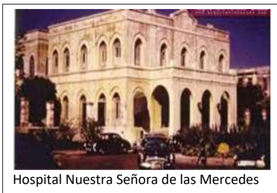
Hospital Nuestra Señora de las Mercedes

Sus esfuerzos estuvieron encaminados hacia los intereses de la nueva generación, el estado de salud de la niñez; incluyendo su atención, bienestar y felicidad. Tuvieron una preocupación constante por la situación que presentaba la enseñanza de la pediatría en el país.